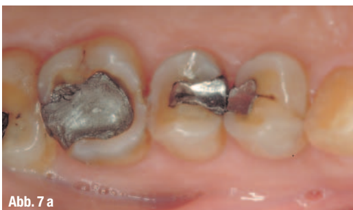
Abb. 7 a