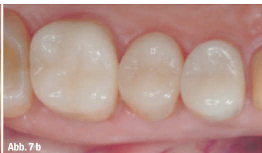
Abb. 7 b