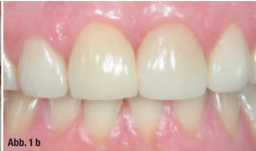
Abb. 1 a, b_ Ausgangssituation für CEREC-Veneers. Schneidekanten-abrasion, ungünstige Zahnstellung und die notwendige Korrektur des Diastemas.