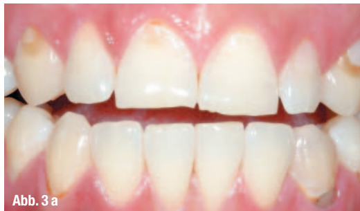
Abb. 3 a, b _ CEREC-Veneers, rückseitig koloriert und in einer Sitzung hergestellt und eingegliedert.