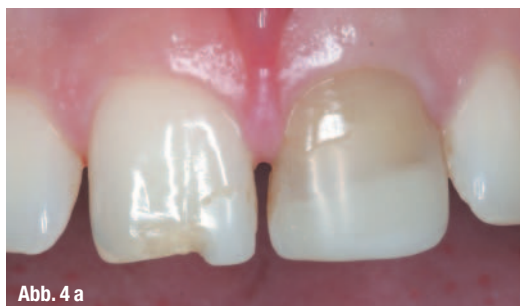
Abb. 4 a, b _Fraktur nach Schwimmbadunfall und Versorgung mit CEREC-Frontzahnteilkrone.

Obwohl die Verwendung von Keramik als erstes an Frontzahnkronen denken lässt, ist die Herstellung von CEREC-Frontzahnkronen in der zahnärztlichen Praxis eher die Ausnahme. Im Gegensatz zu den Veneers und Frontzahnteilkronen, die sowohl medizinisch indiziert sind als auch wirtschaftlich einen durchaus nen-