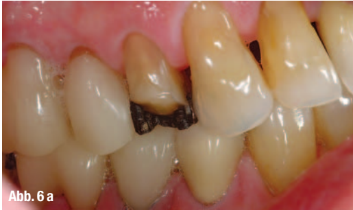
Abb. 6 a