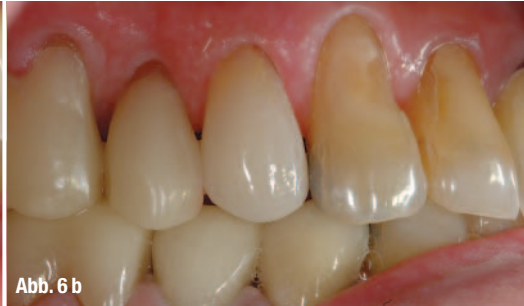
Abb. 6 b